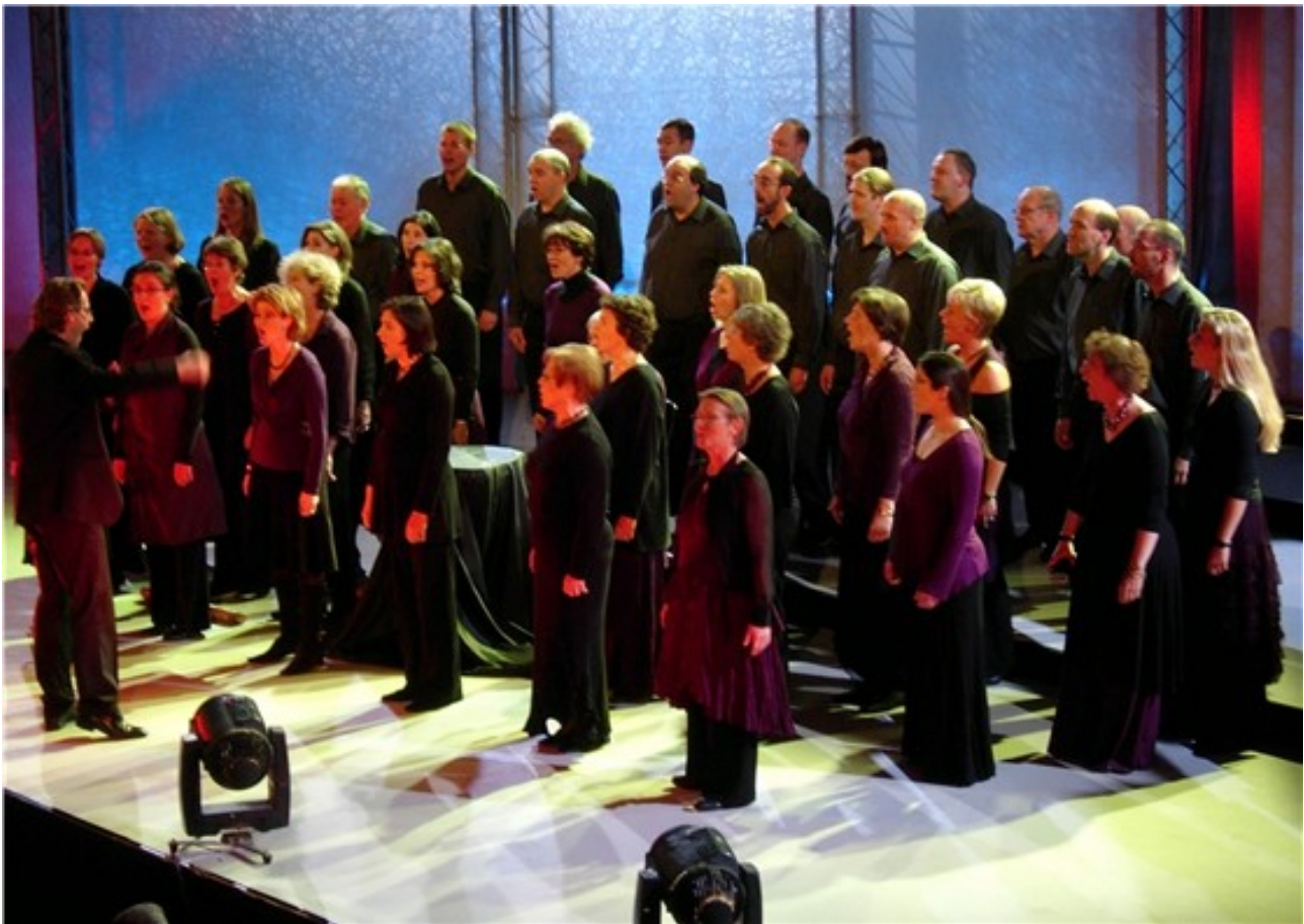
Con Cuore Waregem