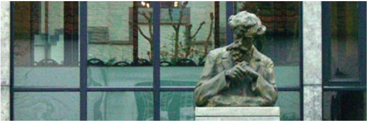
Karel van de Woestijne 1909 (Carl De Cock), bronzen replica 2004

Tegen de glazen westgevel van de raadzaal van het gemeentehuis staat de bronzen buste van Karel Van de Woestijne, in 1909 door de Latemse beeldhouwer Carl De Cock in gips ontworpen. Ter gelegenheid van de eerste editie van de Karel van de Woestijneprijs voor Poëzie werd in 2004 een replica in brons afgegoten. Het beeld is een blijvende huldeblijk aan de schrijver-dichter die zeven jaar in Sint-Martens-Latem heeft gewoond en door zijn teksten in bijzonder mate heeft bijgedragen aan de reputatie van Sint-Martens-Latem als kunstenaarsdorp.