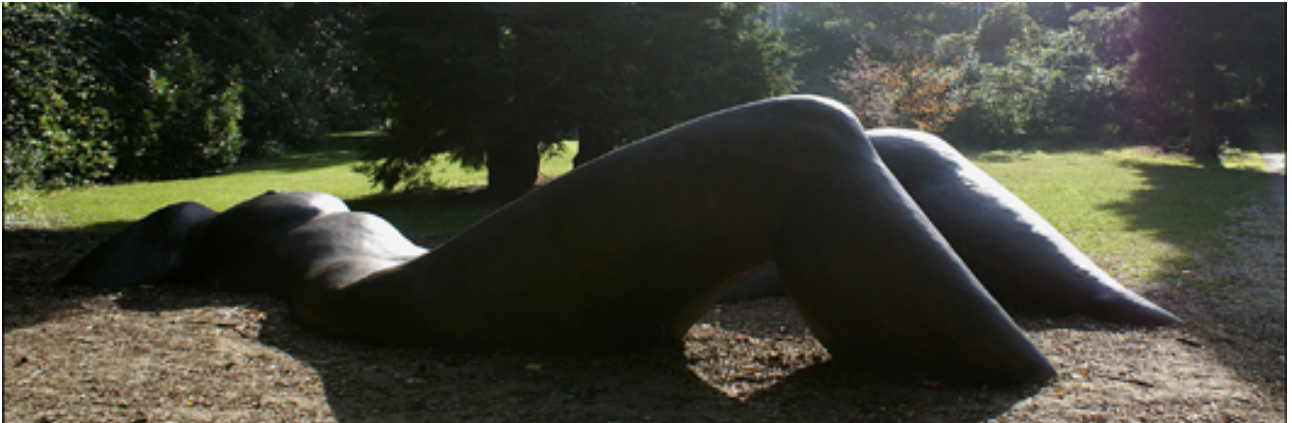
Moeder Aarde II (2008)